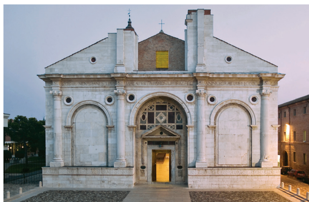
Tempio Malatestiano, Rimini